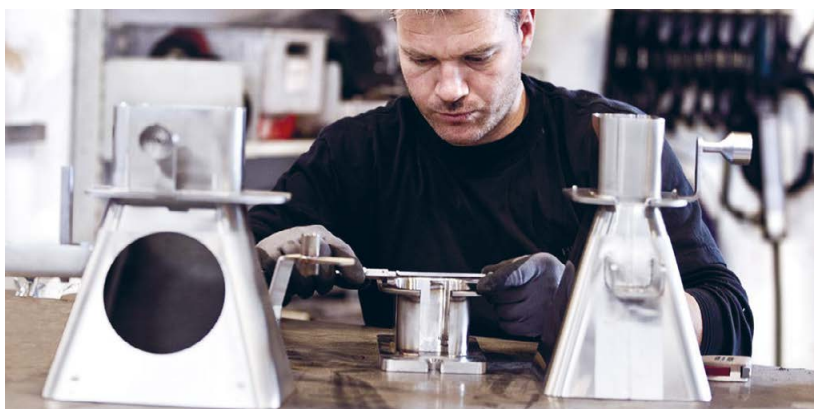
Brimas producerer kundespecifikke specialopgaver i rustfrit stål, aluminium og jern.

”Systemet har store fordele i forhold til dokumentation og har ligeledes en rigtig god søgefunktion, så man altid kan finde tilbage i tidligere bilag. Så kan man se, hvad man har købt tidligere og sammenligne ting og sager, men mest af alt giver det en effektivitet i vores bogholderi”. Det