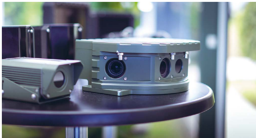
Copenhagen Sensor Technology producerer komplekse overvågningskameraer.

Copenhagen Sensor Technology's lange liste af slutkunder tæller blandt andet en række forsvarsmyndigheder. Ofte kræ-